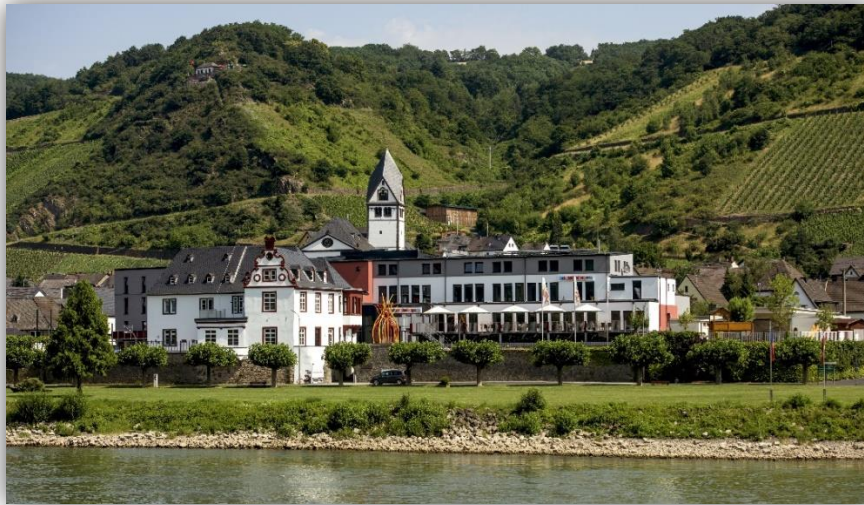
Außenansicht Jugendherberge Kloster Leutesdorf