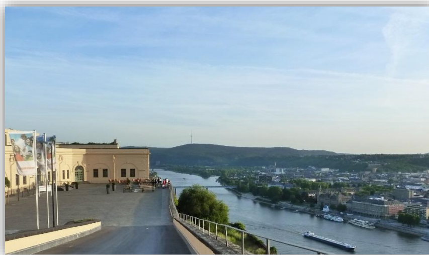
Jugendherberge Festung Ehrenbreitstein