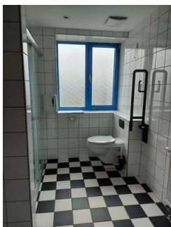
Zimmer mit Sanitärraum 1. OG