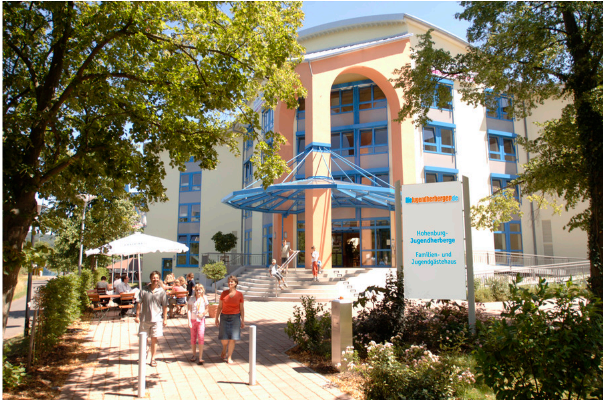
Hohenburg-Jugendherberge Homburg