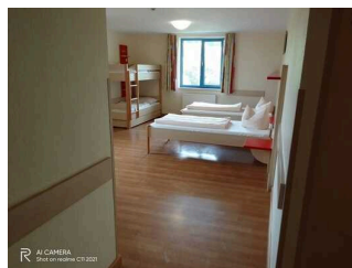
Sicht ins Mehrbettzimmer