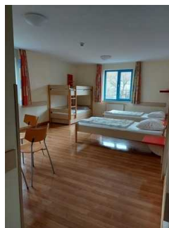
Zimmer mit Sanitärraum 1. OG