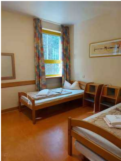
Zimmer mit Sanitärraum 1