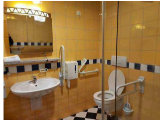
Zimmer mit Sanitärraum 1