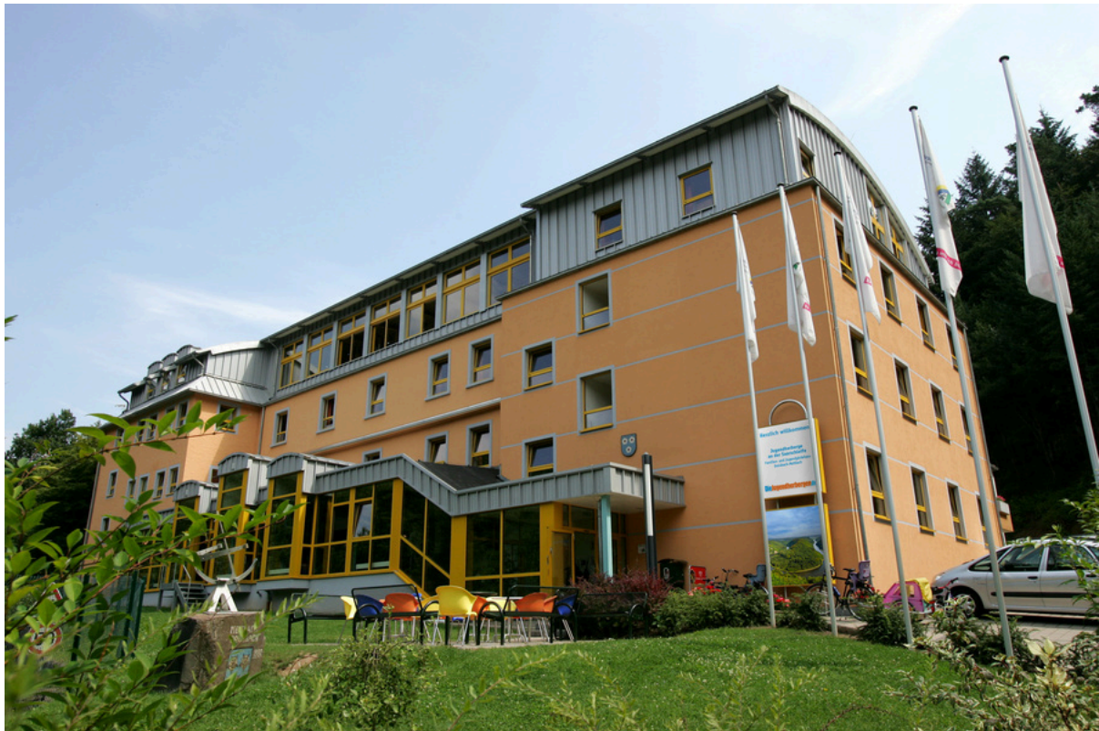
Jugendherberge an der Saarschleife Dreisbach