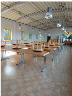
Tagungsraum (3. OG)