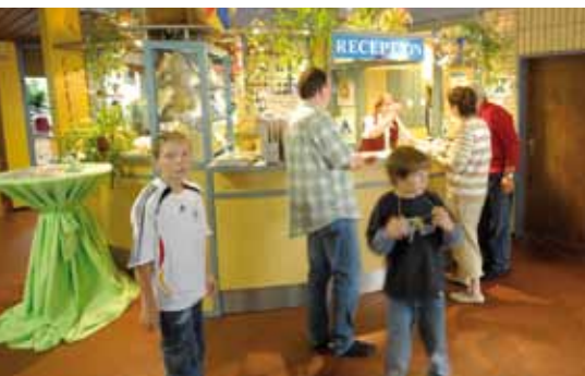
An der Rezeption erfahren Sie alles Wissenswerte für die Gestaltung Ihres Aufenthalts.

So beliebt wie die Stadt ist auch die Mittelmosel-Jugendherberge Traben-Trarbach. Die Jugendherberge bietet einen schönen Blick auf die Mosel und ist ein begehrter Ausgangspunkt, um die Schönheit und Unverwechselbarkeit des Moseltals kennenzulernen. Stil und Flair der Wein- und Jugendstilstadt Traben-Trarbach an der Mittelmosel zeigen sich an den romantischen Fachwerkhäusern.