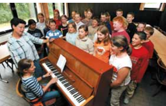
Das Haus bietet beste Möglichkeiten für intensive Musikproben, Seminare oder Workshops.