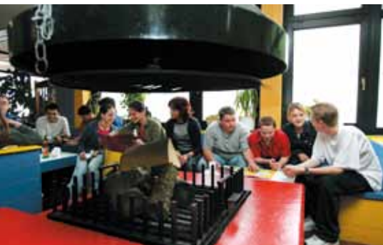
Beliebter Treffpunkt ist das Kaminzimmer in der Jugendherberge Traben-Trarbach.