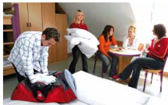
Die modernen Gästezimmer der Jugendherberge sind alle mit Dusche und WC ausgestattet.