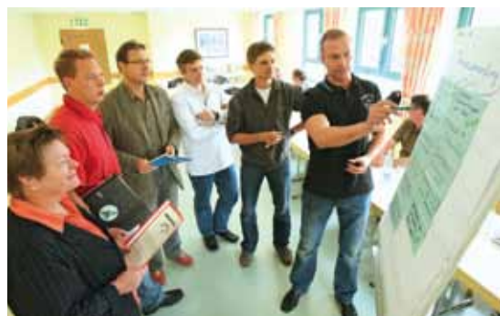
Das moderne Haus eignet sich hervorragend für Seminare, Proben oder Workshops.