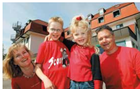
Die Jugendherberge bietet optimale Voraussetzungen für einen Familienurlaub.