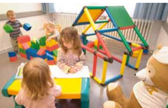
Die kleinen Gäste können in der Jugendherberge ausgelassen spielen und toben.