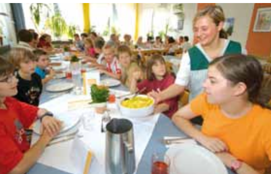
Hier ist für jeden Geschmack das Richtige dabei – wir wünschen guten Appetit!