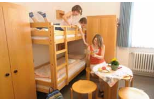
Großzügige Familienzimmer sorgen für eine gemütliche Atmosphäre.

Herzlich und liebevoll ist die Atmosphäre der Westerwald-Jugendherberge Montabaur in der schönen Naturlandschaft des Westerwaldes. Montabaur ist eine jung gebliebene Stadt mit vielen liebenswerten Altentümern. Originalgetreue restaurierte Fachwerkhäuser schmücken die Fußgängerzone, die sich durch den gesamten Stadtkern zieht.