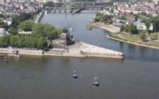
Von der Jugendherberge haben Sie einen herrlichen Blick auf das berühmte Deutsche Eck, dem Zusammenfluss von Rhein und Mosel.