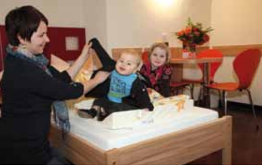
In den modernen und geschmackvoll gestalteten Zimmern fühlen Sie sich garantiert wohl.