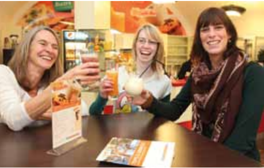
In historischen Gemäuern können Sie im gemütlichen Bistro erfrischende Getränke genießen.

Hier sind Modernität und historische Gemäuer im Einklang. Die Jugendherberge befindet sich in der historischen Festungsanlage Ehrenbreitstein mit unglaublichem Blick über das Rhein- und Moseltal. Die Stadt der Bundesgartenschau 2011 liegt am Zusammenfluss von Rhein und Mosel und ist das Tor zum Welterbe Oberes Mittelrheintal.