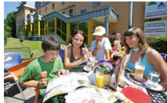
Große und kleine Gäste treffen sich im Bistro, um kühle Erfrischungen und leckere Snacks zu genießen.