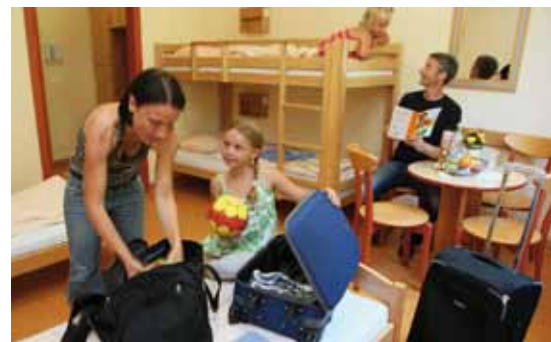
Ihre Familie wird sich in den modernen Zimmern der Jugendherberge wie zuhause fühlen.