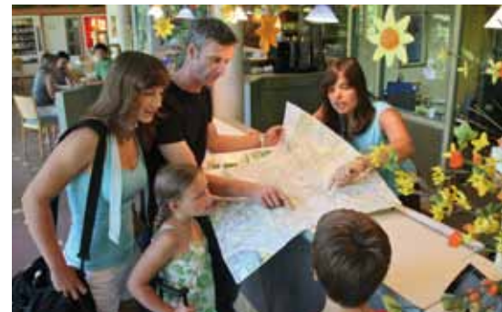
Bei der Planung Ihrer Ausflüge stehen Ihnen die Mitarbeiter der Jugendherberge gerne hilfreich zur Seite.