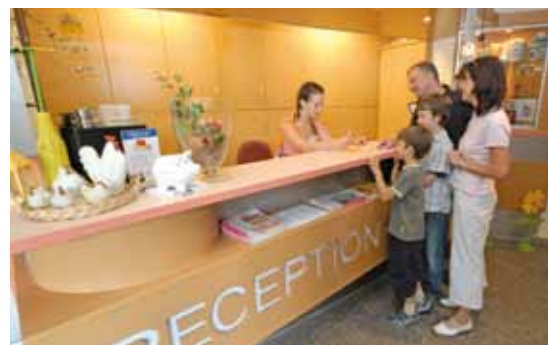
An der Rezeption steht Ihnen das freundliche Team der Jugendherberge gerne mit Rat und Tat zur Verfügung.