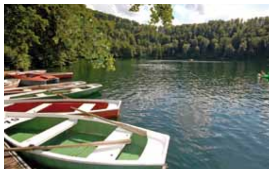
Die berühmten Eifelmaare liegen in unmittelbarer Nähe der Jugendherberge.