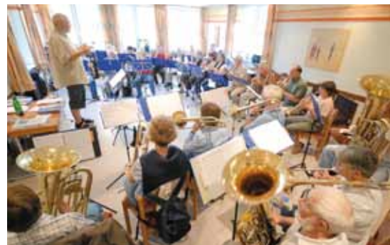
Die Jugendherberge eignet sich bestens für intensive Chor- und Orchesterproben.