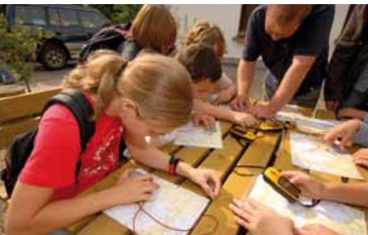
Gehen Sie auf Geocaching-Tour und entdecken Sie den Deutsch-Luxemburgischen Naturpark.