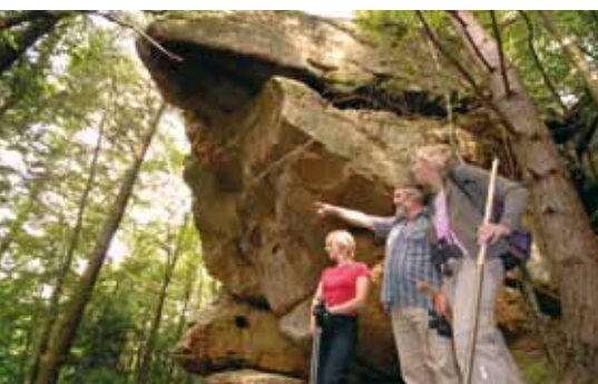
Wanderungen durch die herrliche Felsen- und Flusslandschaft werden Sie begeistern.