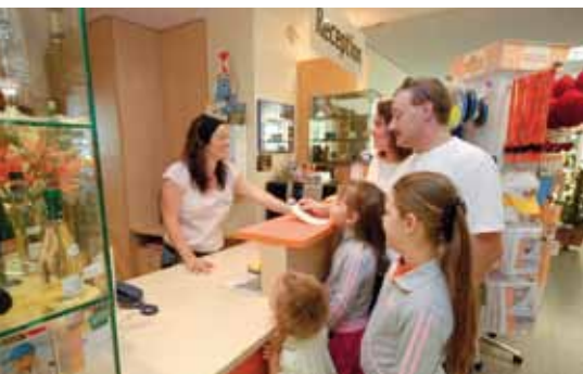
An der Rezeption stehen Ihnen unsere freundlichen Mitarbeiter gerne zur Verfügung.

Hier spürt man den Flair von Luxemburg, das nur wenige Schritte entfernt liegt. Die Südeifel-Jugendherberge Bollendorf liegt oberhalb des Ortes mit einem herrlichen Blick auf das Sauerthal. Bollendorf liegt im Zentrum des Deutsch-Luxemburgischen Naturparks direkt am Grenzfluss Sauer mit vielen Freizeitmöglichkeiten.