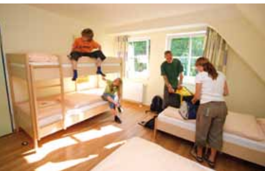
In den modernen und gemütlichen Zimmern fühlen Sie sich garantiert wohl.

Die sehr moderne Naturschutz-Jugendherberge Altenahr liegt in einmaliger Lage an der Ahr, die dort durch das Naturschutzgebiet Langfigtal fließt. Altenahr liegt zwischen zerklüfteten Felsen und steilen Weinbergen. Vielfältige Freizeitmöglichkeiten garantieren einen abwechslungsreichen Aufenthalt.