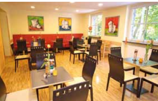
Beliebter Treffpunkt der Jugendherberge Altenahr ist das gemütliche Bistro.