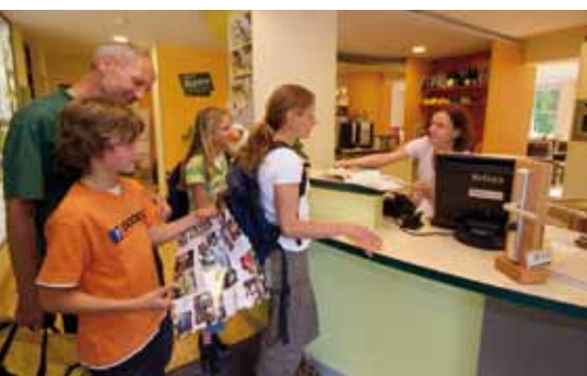
An der Rezeption werden Sie herzlich empfangen.